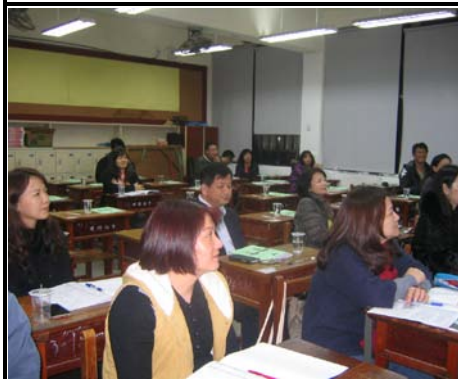
友善校園：家長日宣導活動