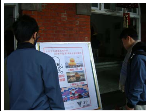
於校園紅樓入口處設置海報加強宣導