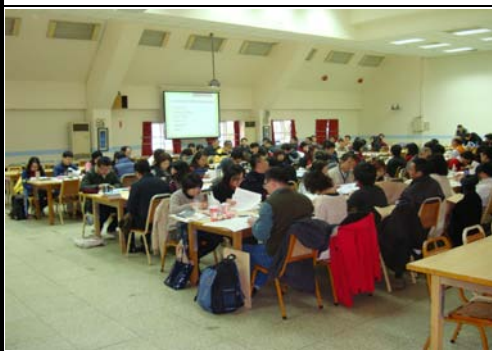
導師聚精會神聽取友善校園相關宣導