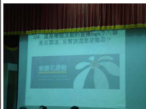
友善校園有獎徵答活動