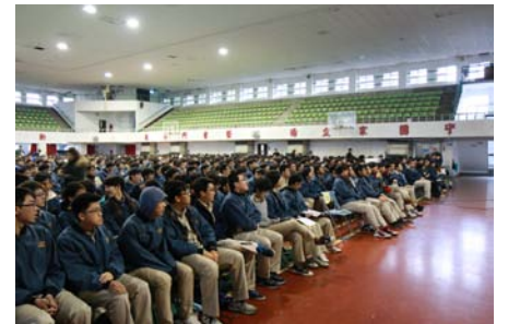
友善校園演講：學生認真聽講