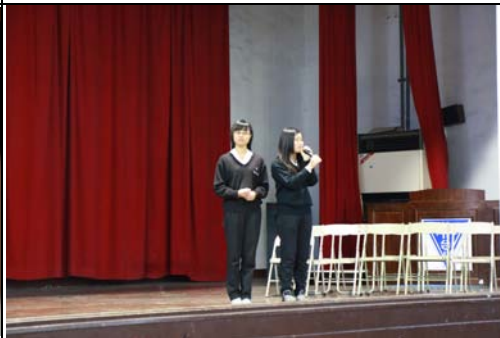
友善校園：品格大聲說分享活動