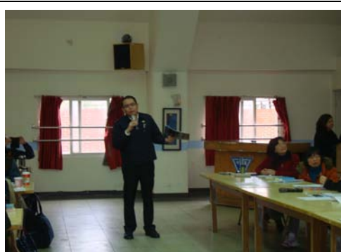
主任教官親自宣導友善校園各項主題