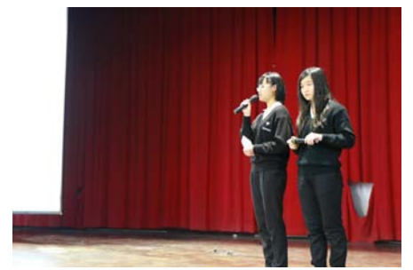
友善校園：品格大聲說分享活動