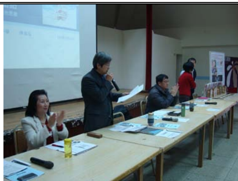
校長在校務會議中對全校教職員工針對友善校園主題