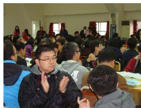
全校教職員工認真聽友善校園相關宣導