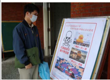
學生觀看友善校園宣導海報