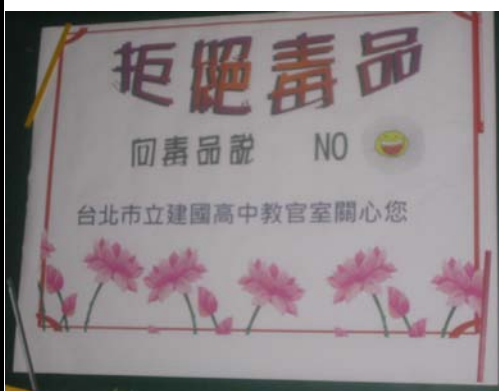
於校園紅樓入口處設置海報加強宣導