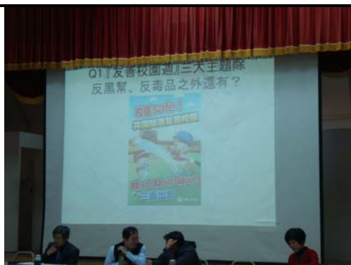
友善校園有獎徵答活動