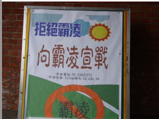
於校園紅樓入口處設置海報加強宣導