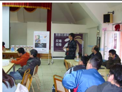
全校教職員工認真聽友善校園相關宣導