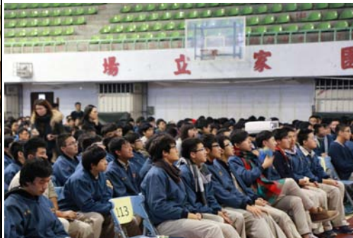
友善校園演講：學生認真聽講