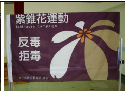
期初校務會議中對全校教職員工進行友善校園宣導