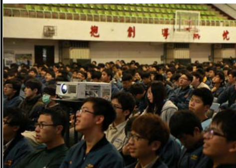
友善校園演講：學生認真聽講