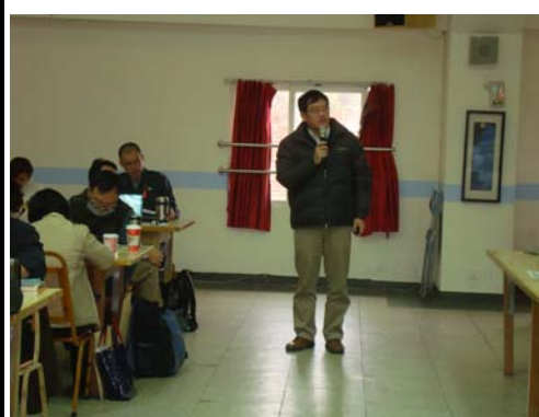
學務主任在期初導師會議中對全校導師進行友善校園宣導