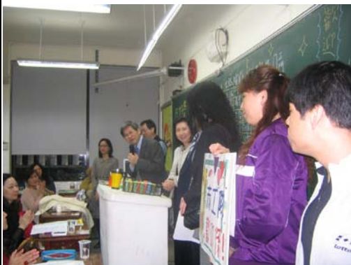
友善校園：家長日宣導活動