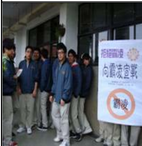
友善校園--反霸凌宣導