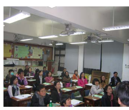
友善校園：家長日宣導活動