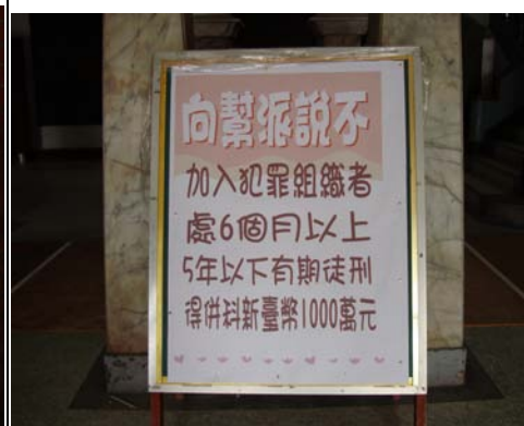
於校園紅樓入口處設置海報加強宣導