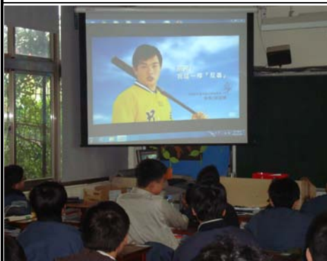
利用全民國防課程做反毒宣導