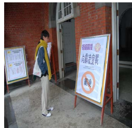
友善校園--反霸凌宣導