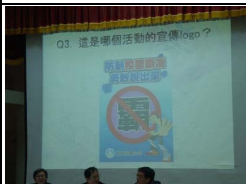
友善校園有獎徵答活動