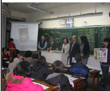
友善校園：家長日宣導活動