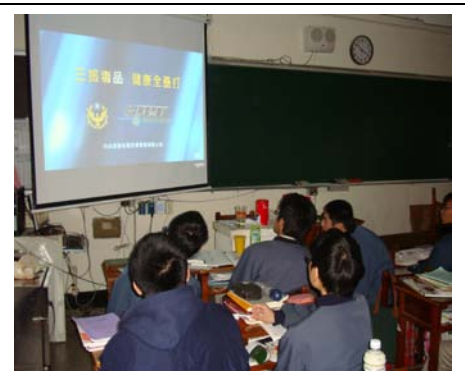
利用全民國防課程做反毒宣導