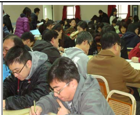
全校導師認真聽友善校園相關宣導並做筆記