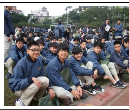
集合學生進行友善校園宣導