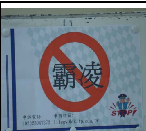
友善校園--反霸凌宣導