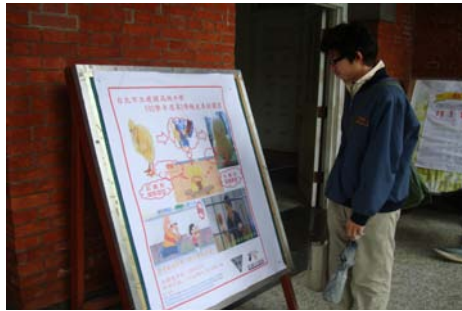
學生觀看友善校園宣導海報