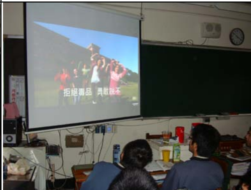
利用全民國防課程做反毒宣導