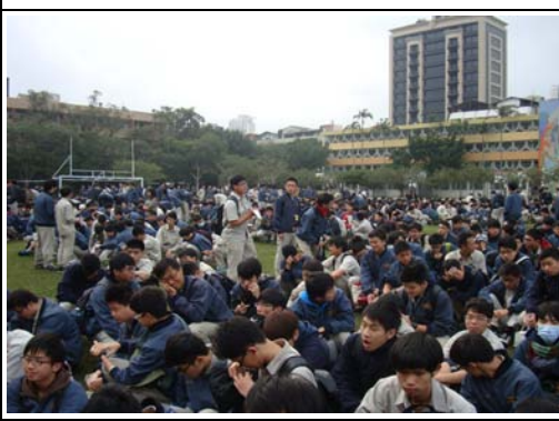
集合學生進行友善校園宣導