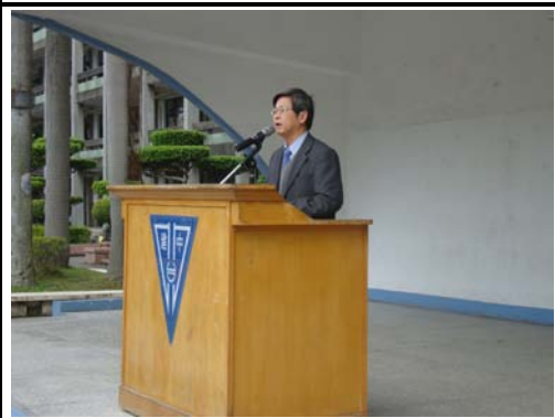
校長利用朝會進行友善校園宣導