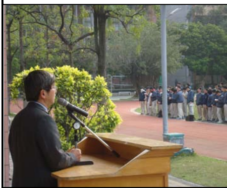
校長利用朝會進行友善校園宣導