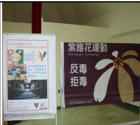
期初學務會議中對全校導師進行友善校園宣導