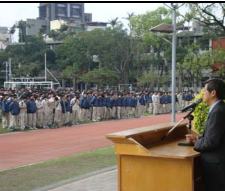
校長利用朝會進行友善校園宣導