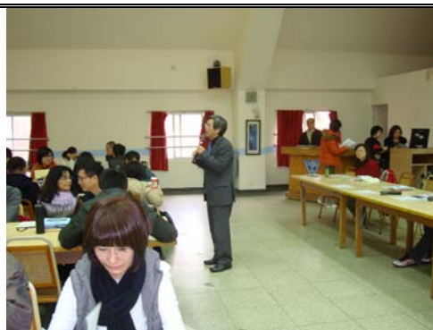
校長對全校教職員工推廣紫錐花標誌及反毒觀念