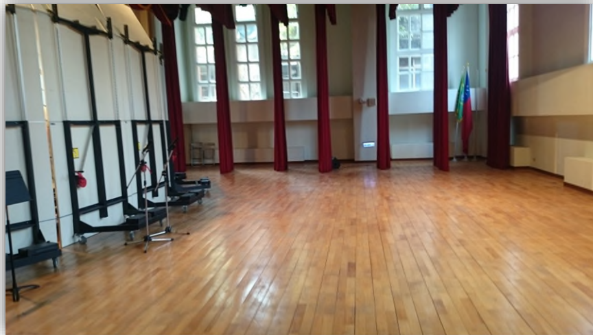
進場（走反響板後方）